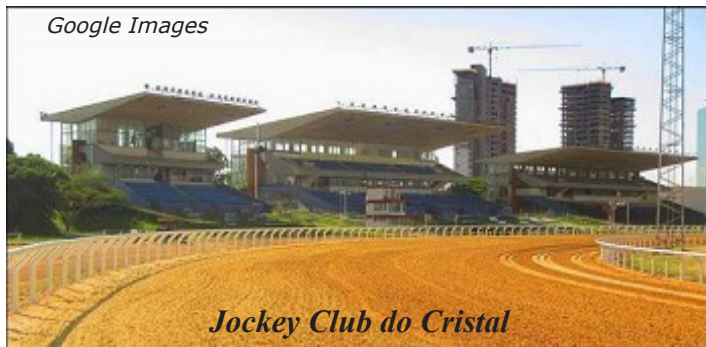
Jockey Club do Cristal