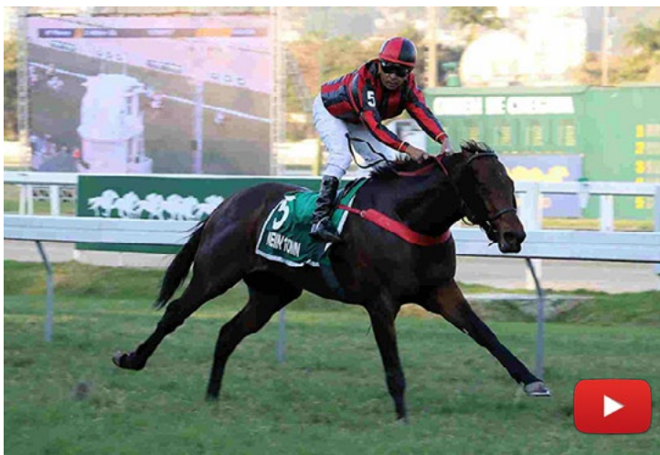
New In Town