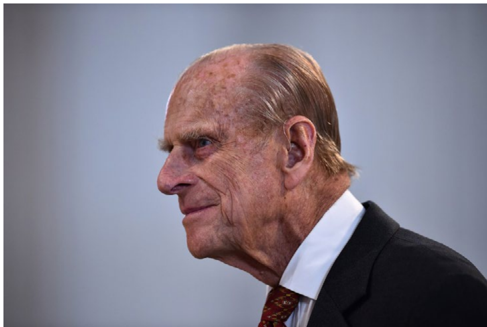
Príncipe Philip em foto de junho de 2016

Segundo porta-voz do Palácio de Buckingham, internação se dá por conta de problema de saúde 'pré-existente', e monarca passa bem.