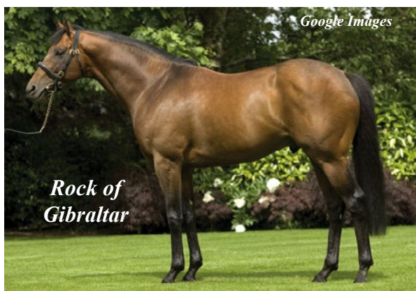
Rock of Gibraltar

Avô materno de: Glamorous Approach -Ire (f, 4, Pai: New Approach-Ire e Maria Lee-Ire)