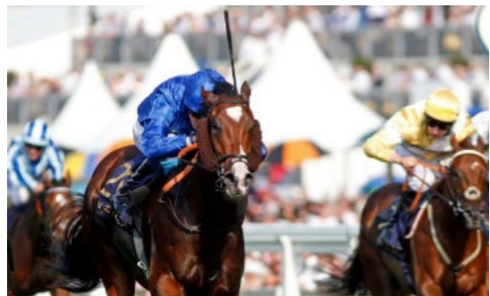
Sound And Silence

Avô materno de: Falcon Wings -GB (m, 3, Pai: Nathaniel-Ire e Cast In Gold-USA)