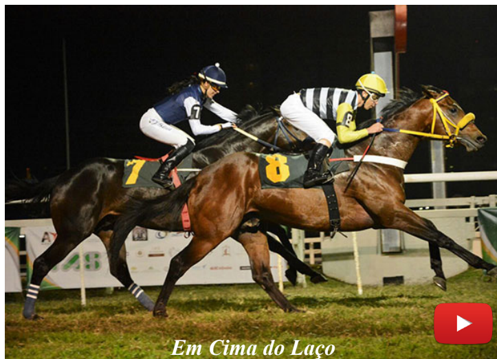
Em Cima do Laço

ACESSE WWW.APFTURFE.COM.BR CADASTRE-SE PARA RECEBER A NEWSLETTER