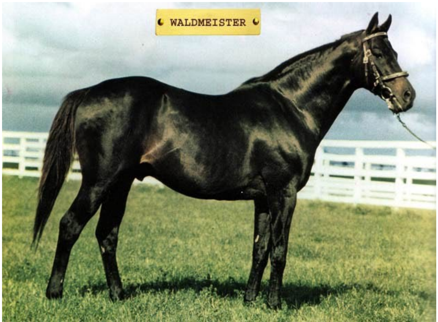
Waldmeister em treinamento