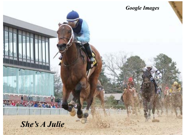
She's A Julie