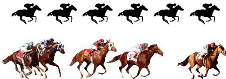
La Vie En Rose