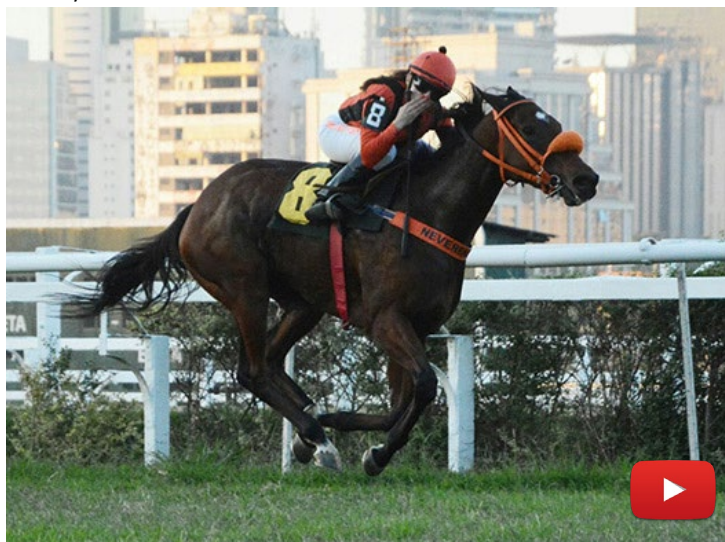
La Vie En Rose

A Seguir: Kings Gate, Evian Royal, Second Time, Five Star, Filadelfia Freedom.