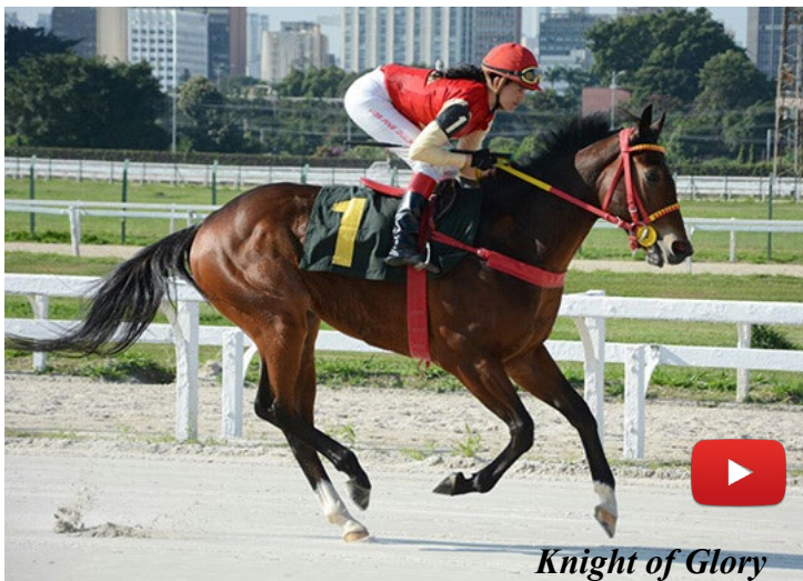
Knight of Glory