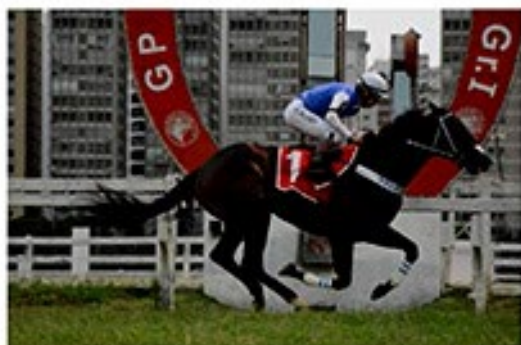
Jopollo foi um dos destaques da geração 2012 no Brasil

Haras Garcêz Castellano readquiriu seu crioulo, que servirá em São José dos Pinhais/PR