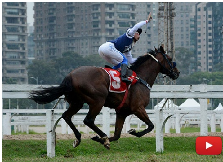
Cash do Jaguetê