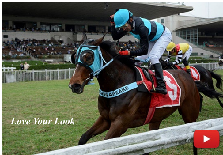
Love Your Look